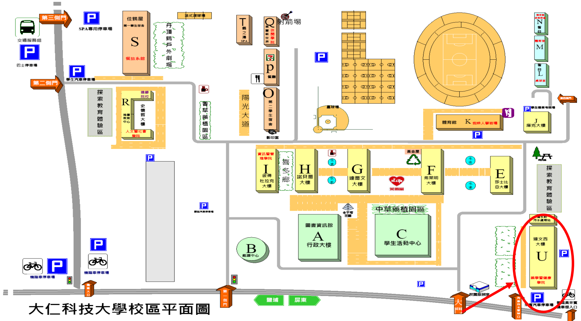
大仁科技大學校區平面圖